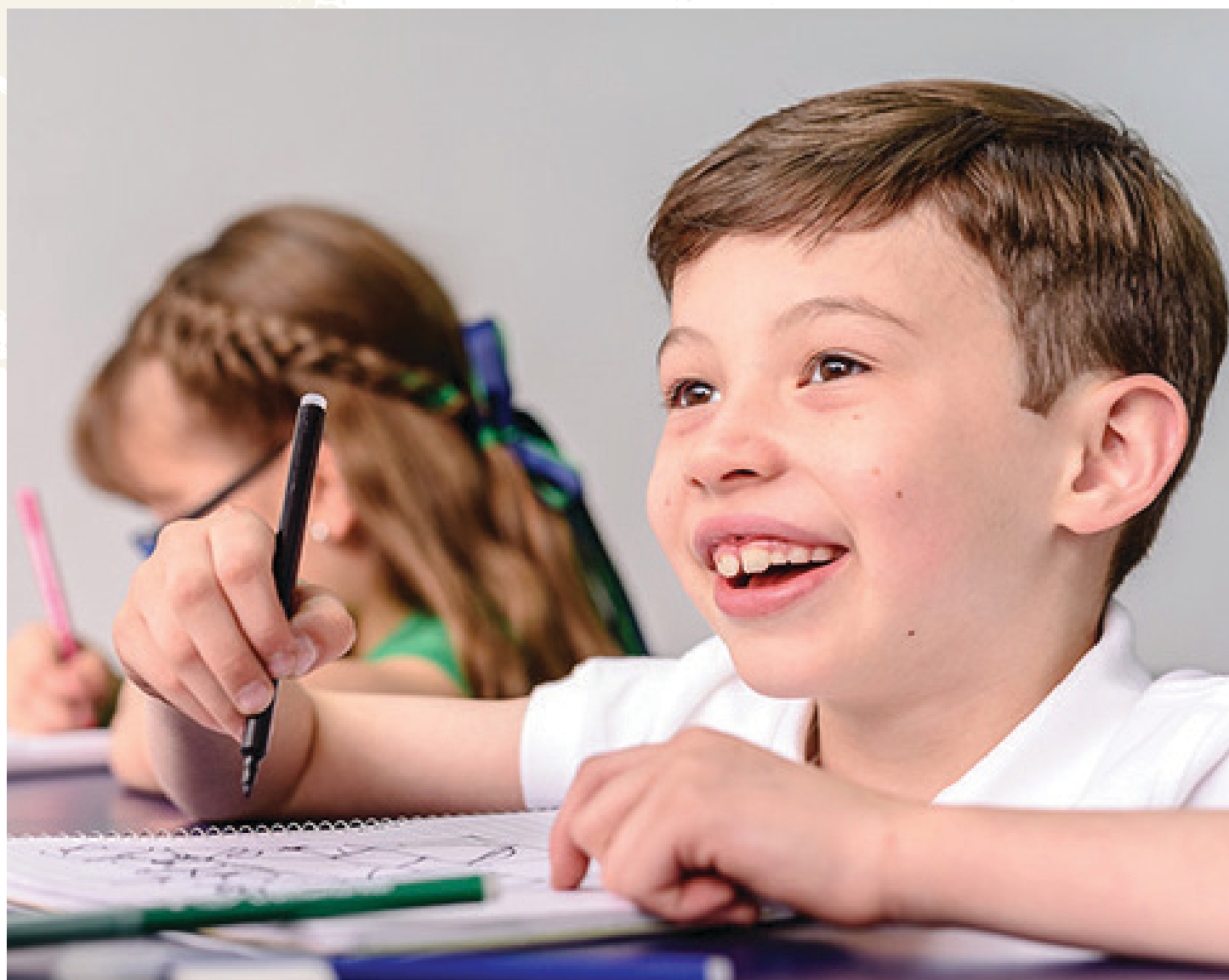
Foto de una sonrisa de un estudiante de BridgeWay North American School, México.