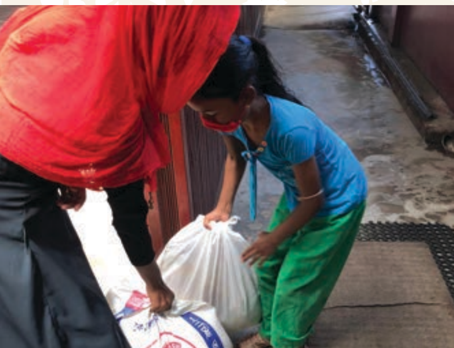
Distribución de comida en varios países en el sur de Asia