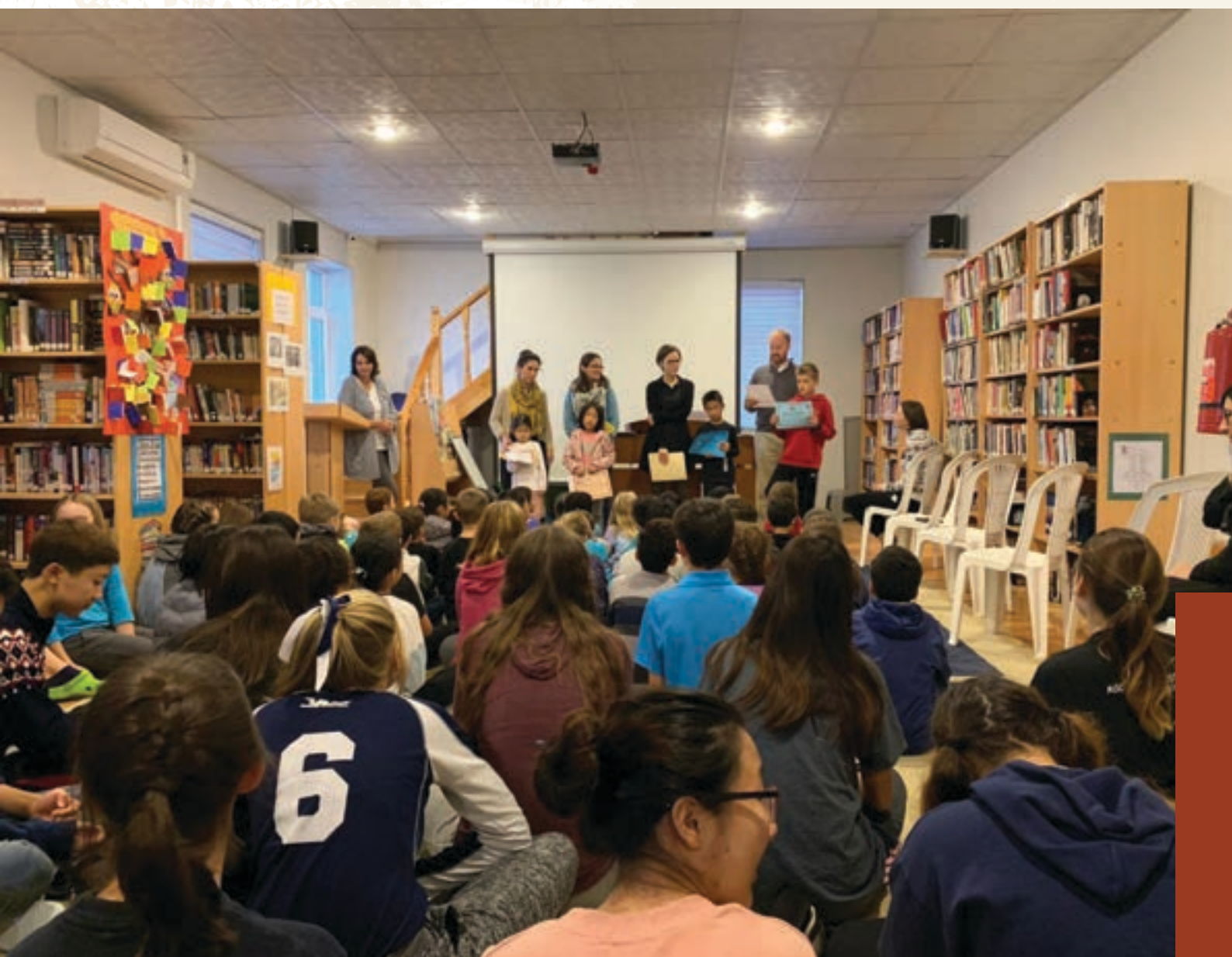
Foto de reunión de escuela en una ubicación de acceso creativo.