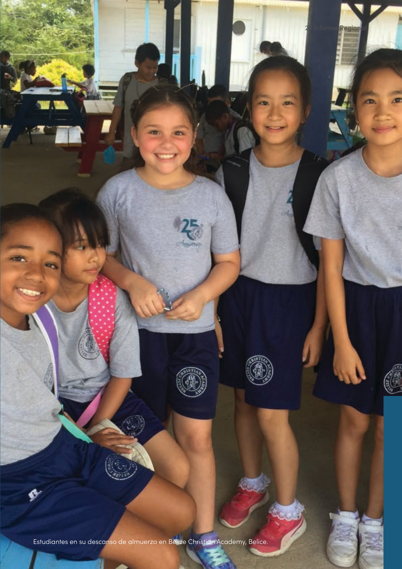
Estudiantes en su descanso de almuerzo en Belize Christian Academy, Belice.