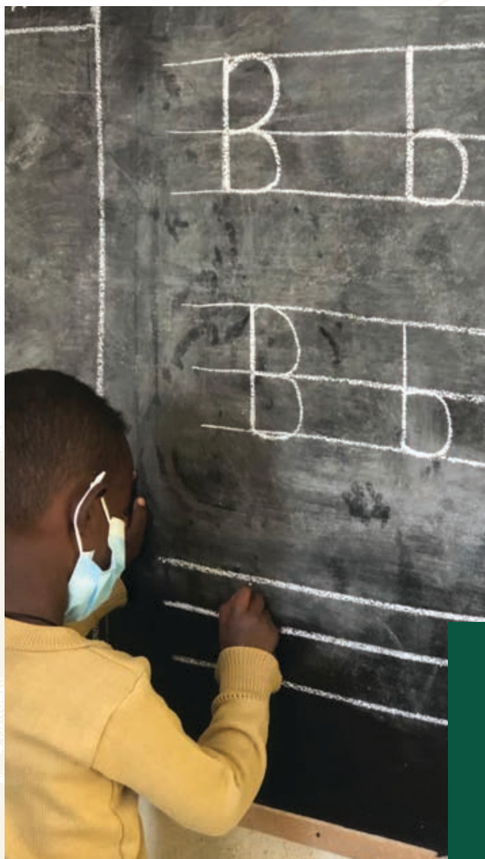
Estudiante de Beyond Borders trabajando muy duro.